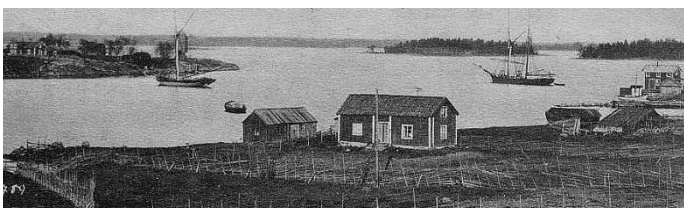
Vykort från 1900-talets början, här syns den gamla kvarnen på udden

Härifrån skeppades ved till Stockholm. Långa staplar låg då på byallmännigen i väntan på transport.