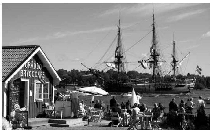
Bilden på Götheborg är från dess första besök i Norrtälje.