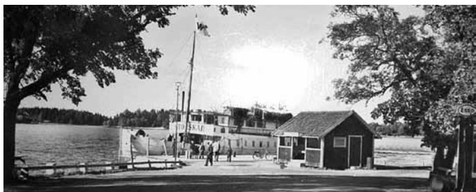
Storskär vid Gräddö

de man ta både gytte- och tallbarrsbad. Anläggningen nyttjades av såväl av ortsbor som sommargäster. 1914 upphörde verksamheten och huset såldes till pensionatet på Gräddö Asken där det inreddes till boende för sommargäster. Flytten skedde över isen med en kälke under vart hörn dragen av häst.