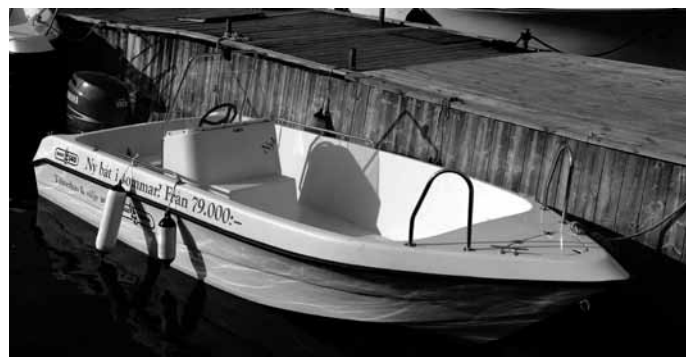
Dagens båtfabrikation på Gräddös båtvarv Graddo 540

Idag är det ett traditionellt småbåtsvarv och marina. Reparationer, vinterförvaring, vårustning e t c. Man har även nu en egen tillverkning. Styrpulpbåten – GRADDO 540 – ”som passar till allt och alla”. 5,4x2,10 m, höga fribord, lätt drivet skrov, hydraulstyrning mm.