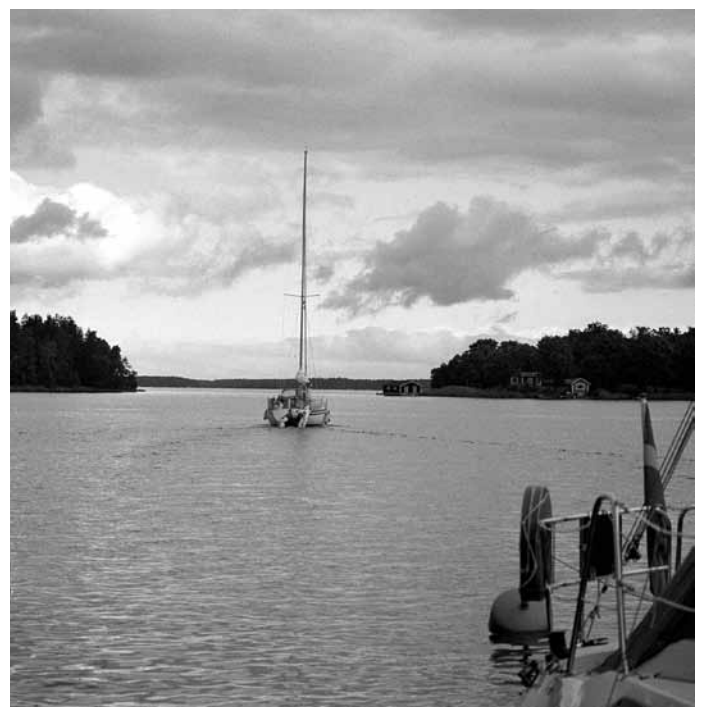
På nordlig kurs från den populära gästhamnen