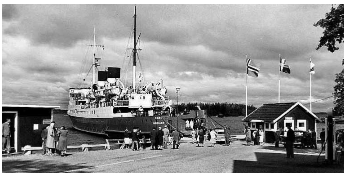
s/s Viking i Gräddö