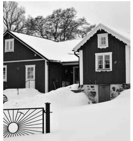
Brukets gamla affär

Säkert var det så att byborna hjälptes åt med kreaturen, att röja skog, plocka sten ur marken för att öka arealen. Vilket slit det måste ha varit. Så viktigt för överlevnadens skull. Gemenskap i arbetet var en nödvändighet.