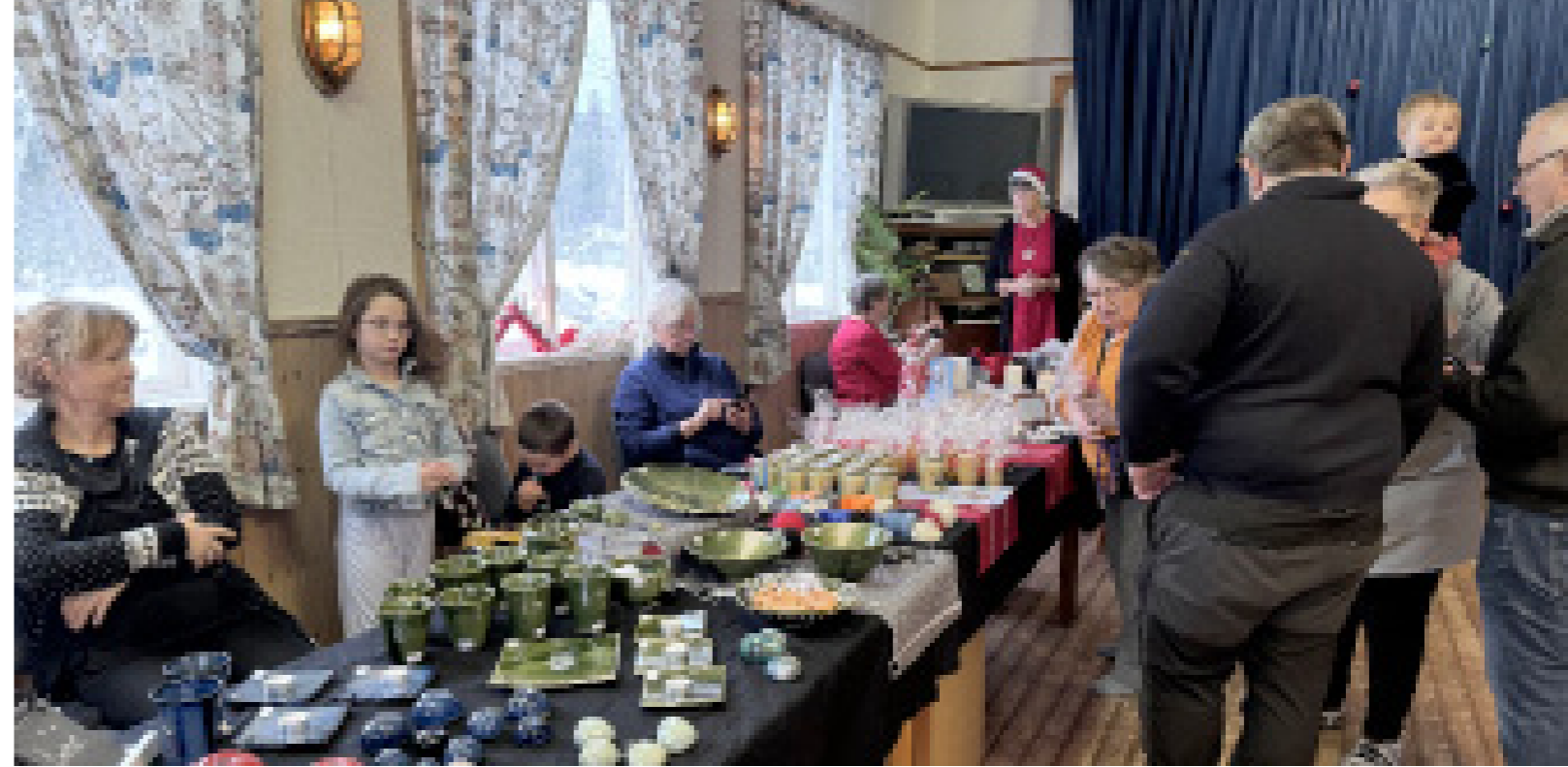
Keramik, Tjocköproducerad honung och hemstickat, vad mer kan en julmarknad behöva? Foto: