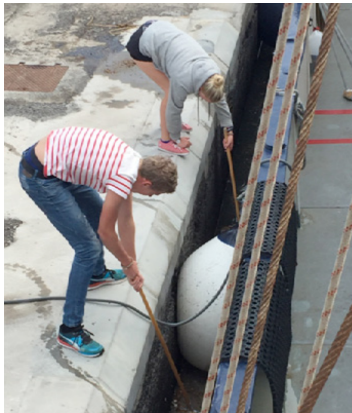
Elever engagerar sig för miljön och hävar upp skräp mellan kajen och båten.