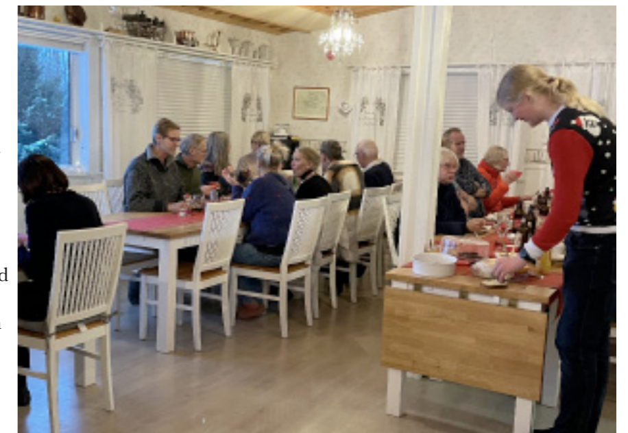
Efter inköpen på marknaden satt det fint med en jultallrik på krogen.