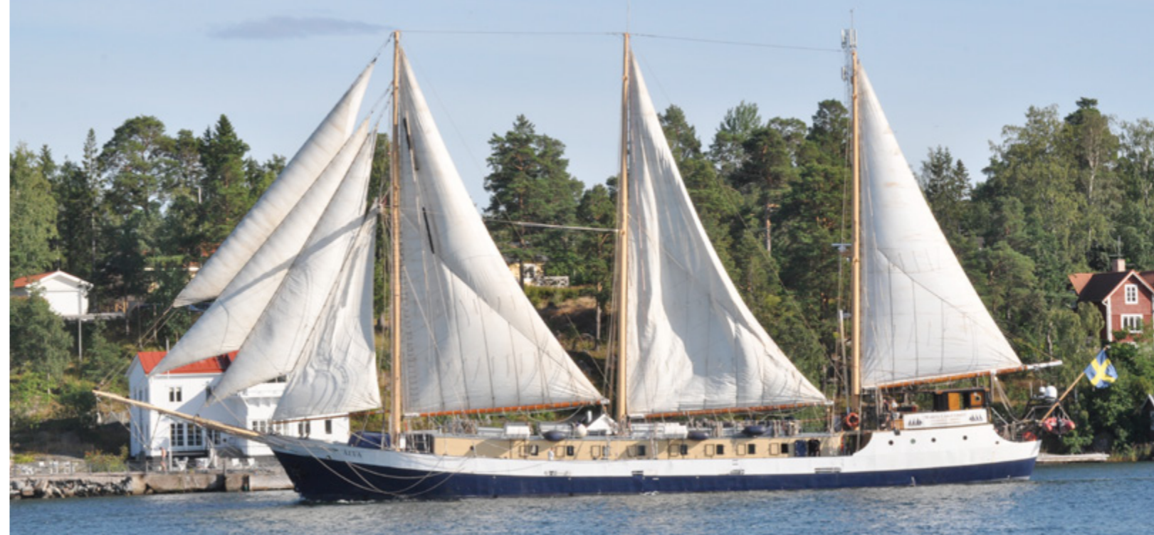
T/S Älva är ett av de fartyg som eleverna gör längre eller kortare resor med.