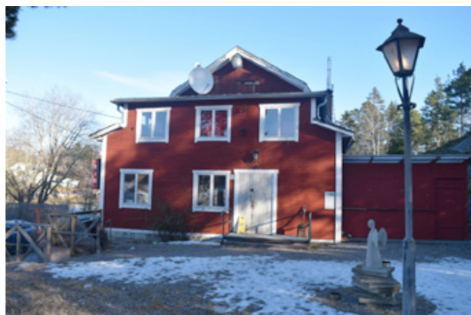
Blidö Bio.