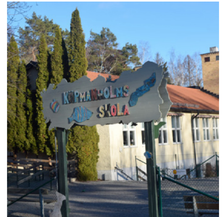
Köpmanholms skola är en av skärgårdens skolor som fortfarande är öppen.

På senare tid har detta ofta varit det bärande argumentet för att lägga ner skolor på landsbygder: kompetensbristen. Förut var det i princip alltid ekonomin som anfördes.