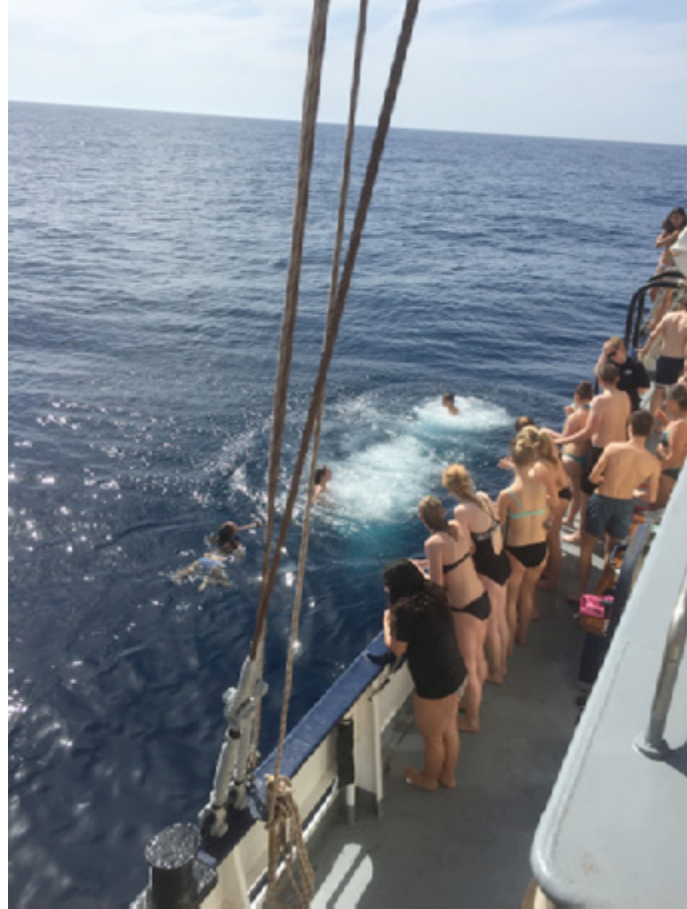
Badstopp på Atlanten.