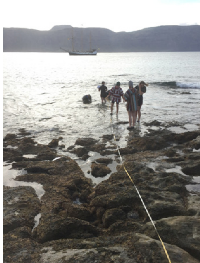
Elever på marinbiologiprogrammet gör en marinbiologisk undersökning.