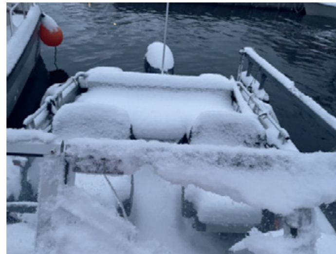
Vissa dagar önskar jag att jag hade en 'inomhusbåt'.