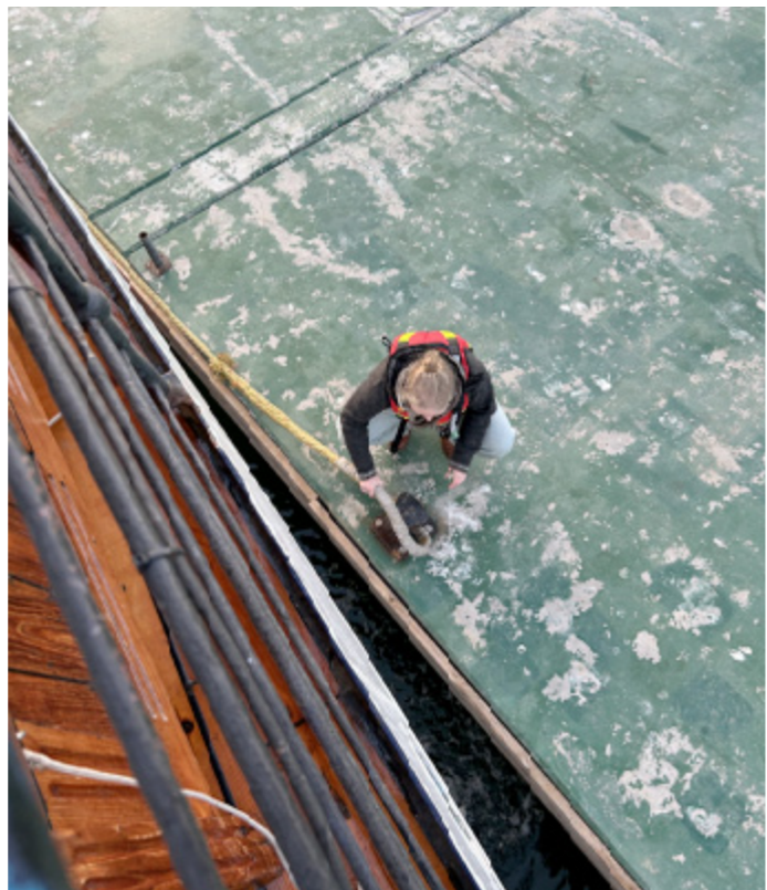
Dags för losskastning. Eleverna hjälper till vid varje ankomsst och losskastning.