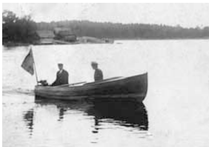
Gammal bild från Skäret med bodar som idag inte finns kvar.

Fruga nummer två var yngre, men också hon handikappad efter barnförlamning. Hon satt i en rullstol som hon vevade fram med ett nav mitt fram i brösthöjd.