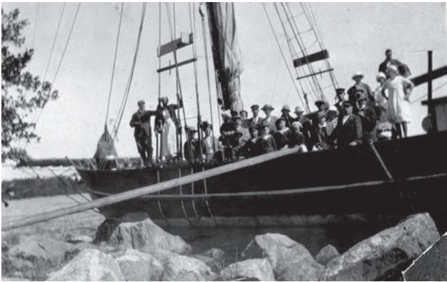
Sommargäster på utflykt