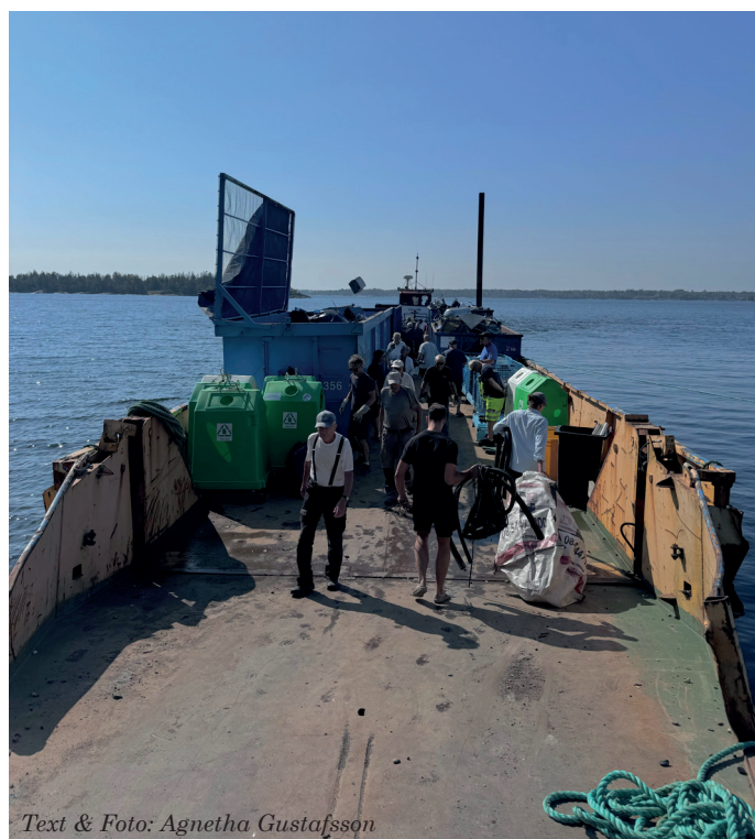
Text & Foto: Agnetha Gustafsson

Så kom den äntligen över fjärden från Gräskö, Återvinningsfärjan. Sällan har väl något varit så efterlängtat som denna plåtpråm med containrar. Tjocköborna hade gått man ur huse och lastat skottkärror och släp fulla med bråte av plast, metall, trä mm. Soporna flög bokstavligen ner i de höga containrarna. Man hjälptes åt för att nå upp och personalen från NVAA såg till att få med allt. Men vi var några som gärna hade tagit ett varv till men då var det fullt och dags att tömma i Kapellskär innan nästa dags tur till Arholma.